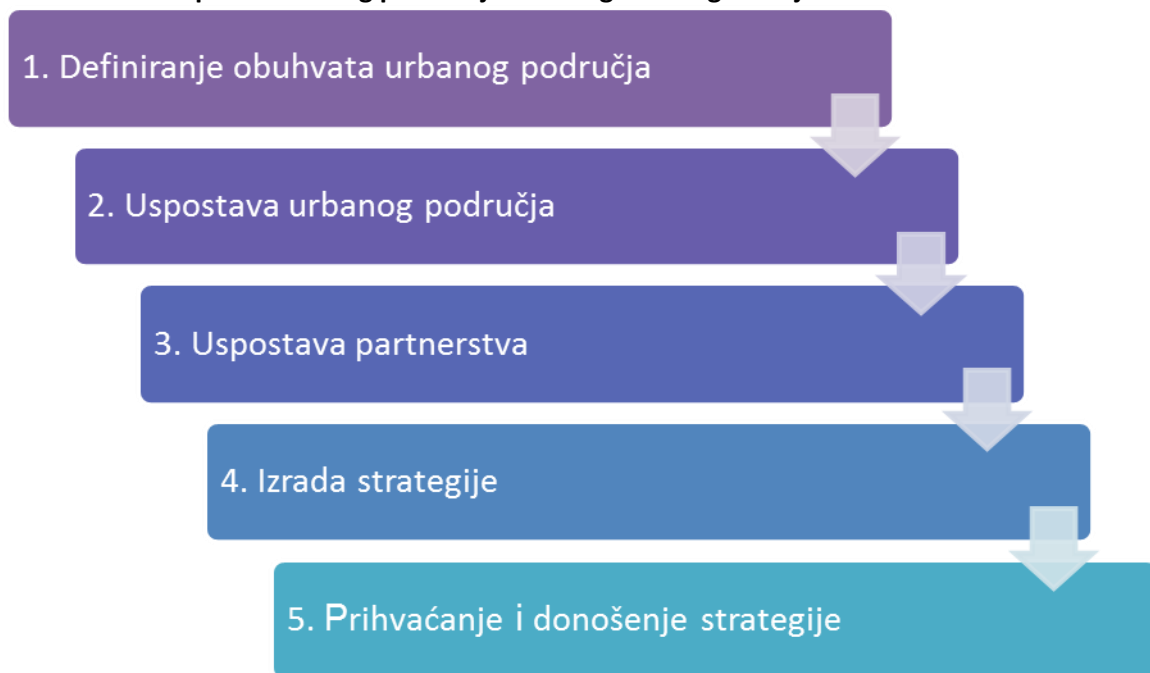
SLIKA 1 – Postupak strateškog planiranja održivog urbanog razvoja

Postupak strateškog planiranja održivog urbanog razvoja strukturiran je na sljedeći način: