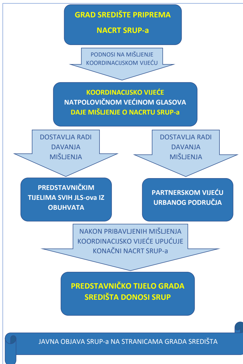
Slika 1: Shematski prikaz postupka izrade/izmjene/donošenja SRUP-a