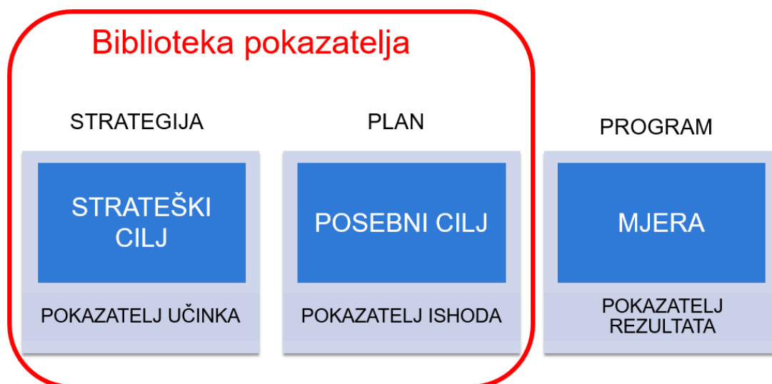
Slika 2. Glavni elementi akata strateškog planiranja Republike Hrvatske

Uredba o smjernicama za izradu akata strateškog planiranja od nacionalnog značaja i od značaja za jedinice lokalne i područne (regionalne) samouprave (NN 89/18)